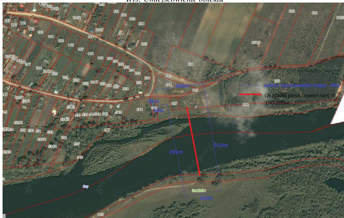
Rys: Umiejscowienie obiektu

1.1. Teren opracowania konkursowego znajduje się w północno-wschodniej części Gminy Mielnik a zarazem Województwa Podlaskiego, na styku Białorusi i Województwa Lubelskiego, oraz Gminy Konstantynów położonej w północno-wschodniej części Powiatu Białskiego. Obejmuje on obszar oznaczony na poniższym rysunku. Mapa do celów projektowych z uzbrojeniem terenu znajduje się w części B regulaminu konkursu.