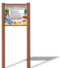
I-02/1 TABLICA REGULAMIN